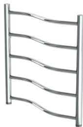
Рис.1 Лесенка Л(нижний подвод)