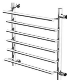
Рис. 3 Лесенка ЛБ (Боковой подвод)